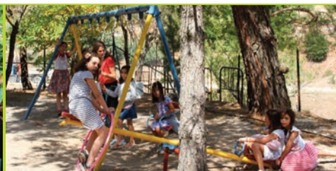
Σύναξη Νέων Οικογενειών